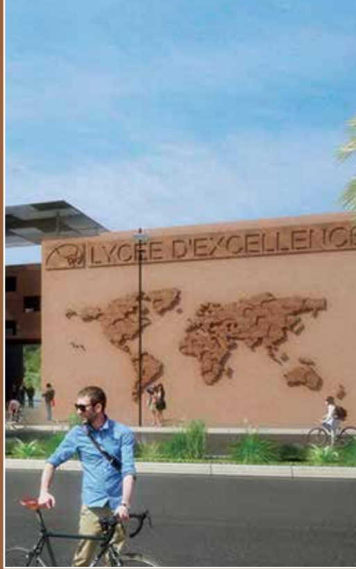
رسم ثلاثي الأبعاد لثانوية التميز- في طور الإنشاء